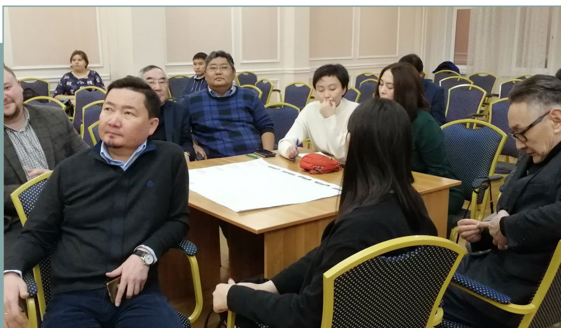
Проектная сессия в г. Улан-Удэ по подготовке стандарта. 25 ноября 2019 года