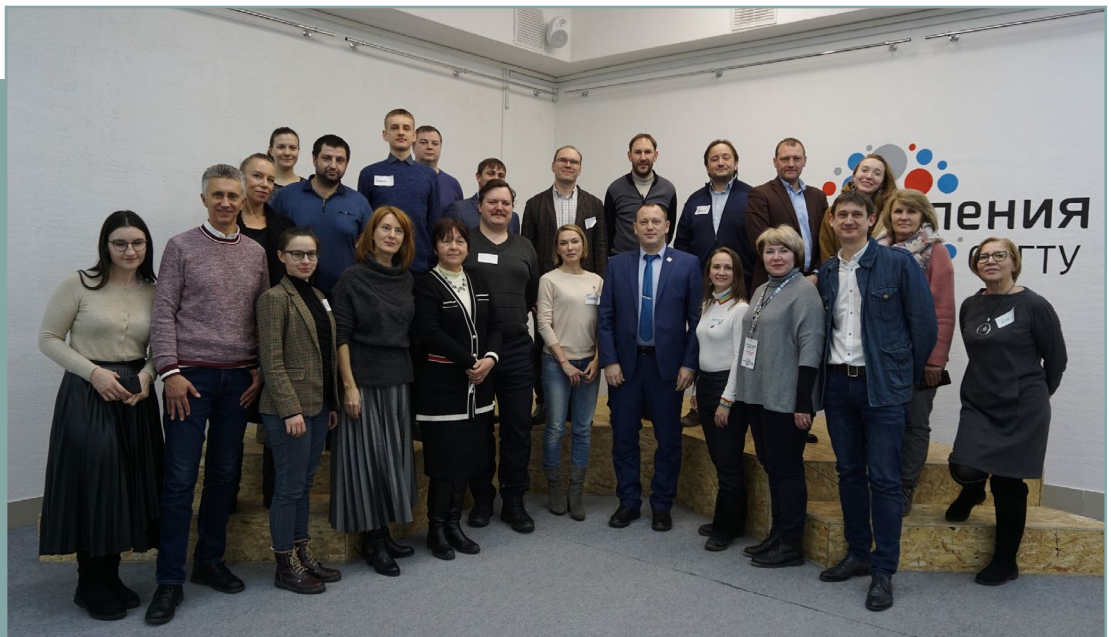
Проектная сессия в г. Омск по подготовке стандарта. 30 января 2020 года