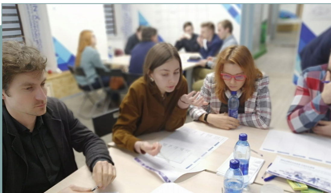
Проектная сессия в г. Ярославль по подготовке стандарта. 30 января 2020 года