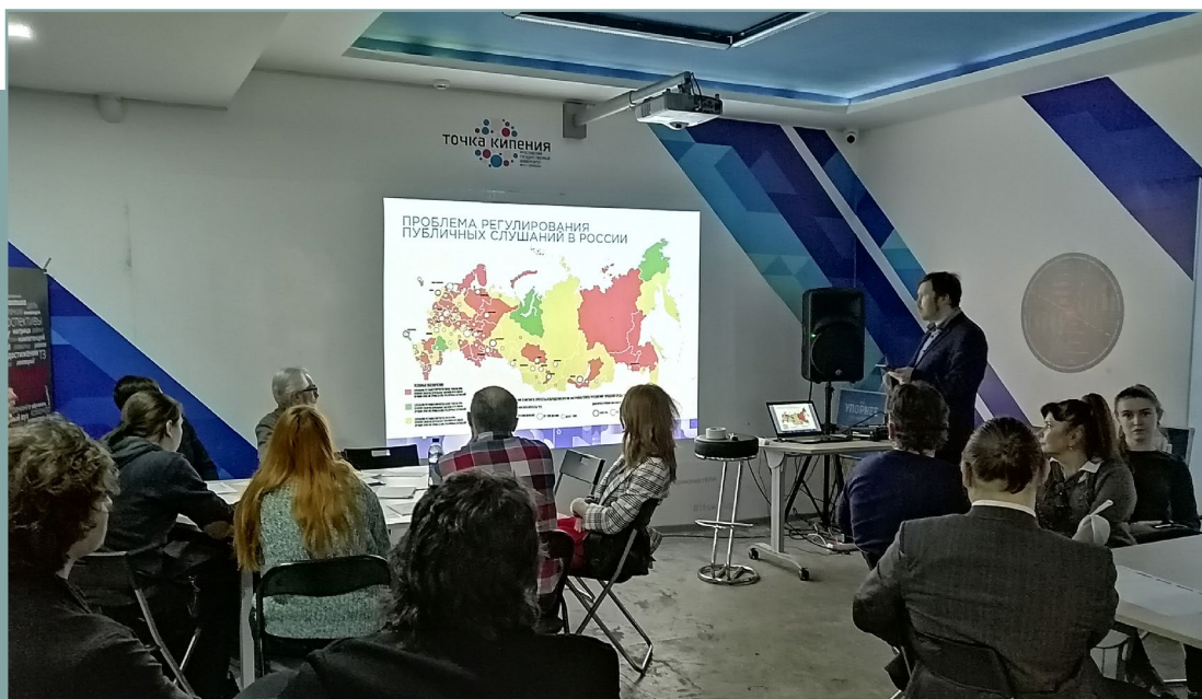
Проектная сессия в г. Ярославль по подготовке стандарта. 30 января 2020 года