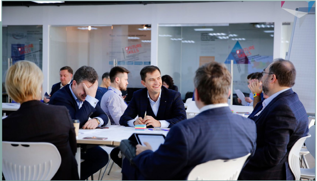
Проектная сессия в г. Москва по подготовке стандарта. 13 ноября 2019 года