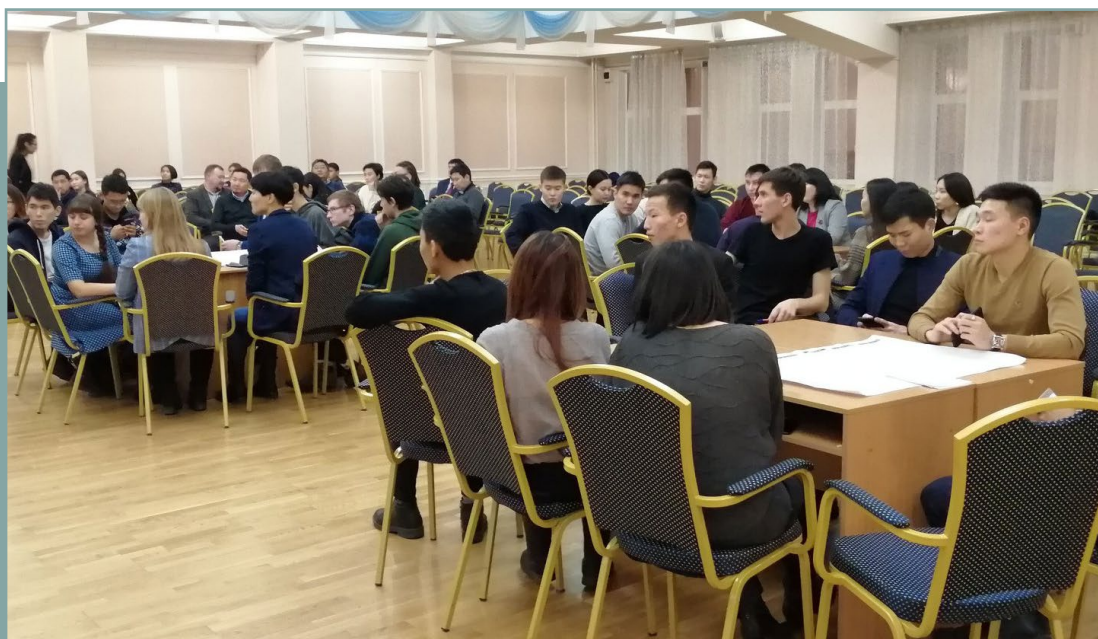
Проектная сессия в г. Улан-Удэ по подготовке стандарта. 25 ноября 2019 года