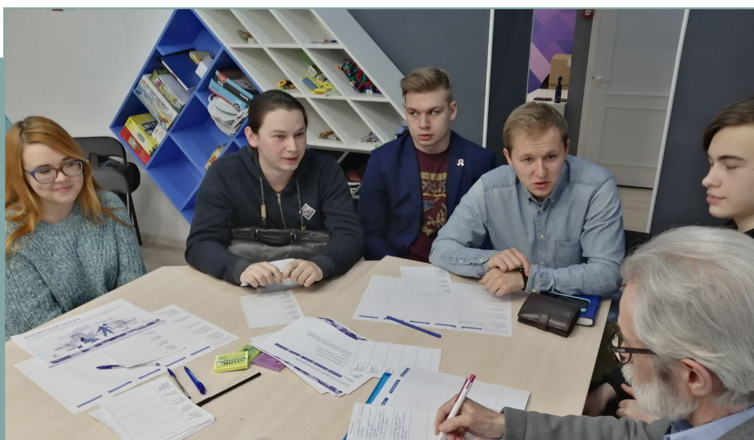
Проектная сессия в г. Ярославль по подготовке стандарта. 30 января 2020 года