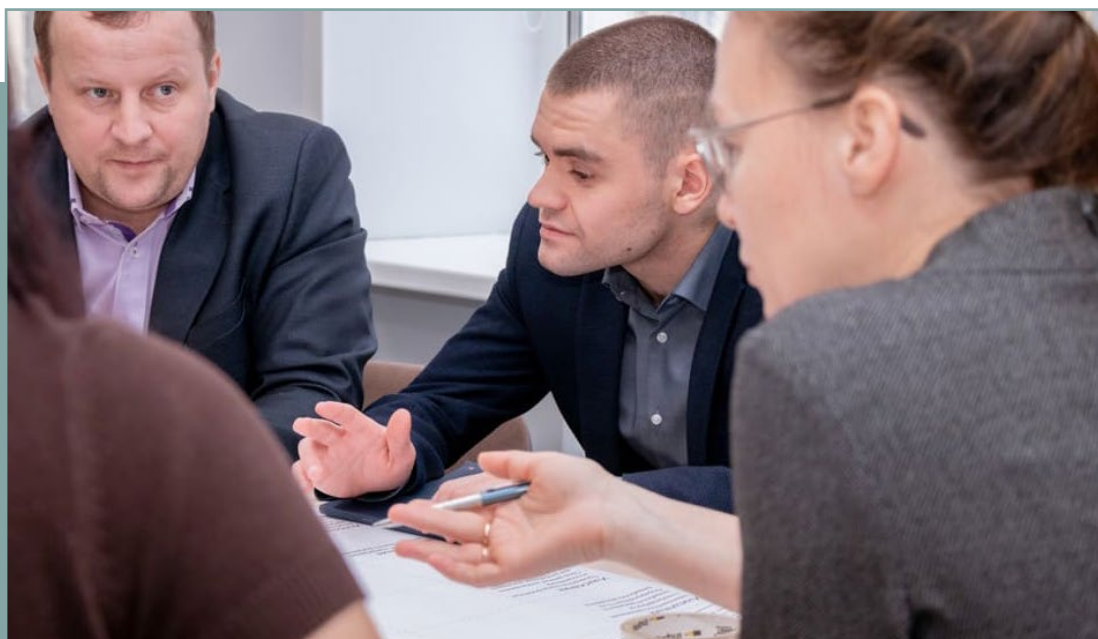
Проектная сессия в г. Тюмень по подготовке стандарта. 30 января 2020 года