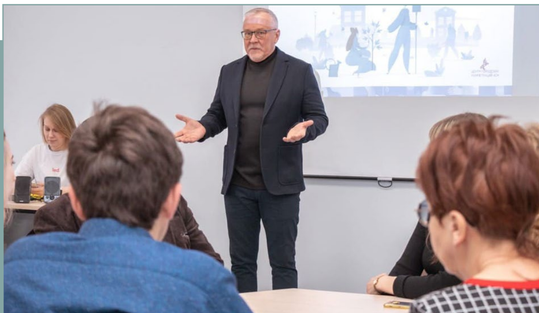
Проектная сессия в г. Тюмень по подготовке стандарта. 30 января 2020 года