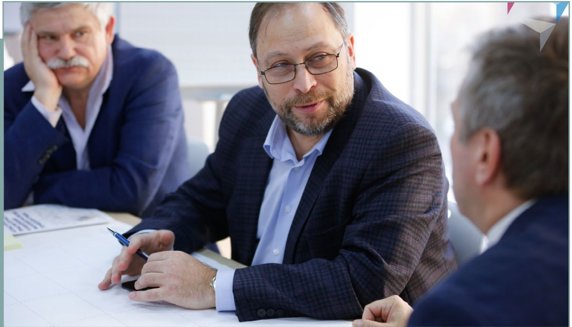
Проектная сессия в г. Москва по подготовке стандарта. 13 ноября 2019 года