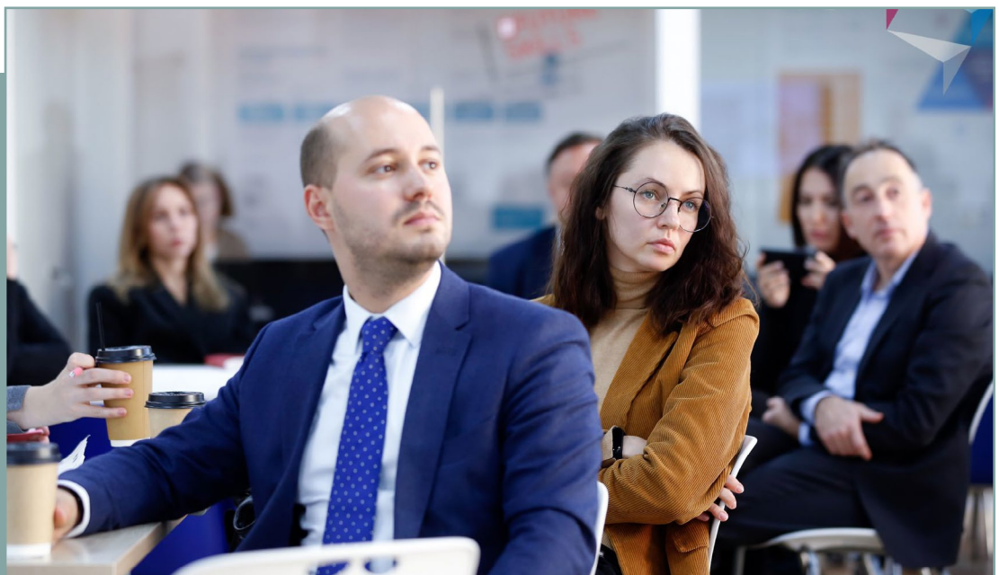
Проектная сессия в г. Москва по подготовке стандарта. 13 ноября 2019 года