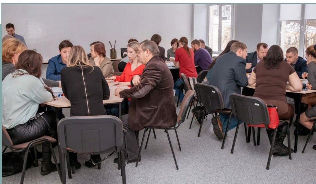
Проектная сессия в г. Тюмень по подготовке стандарта. 30 января 2020 года