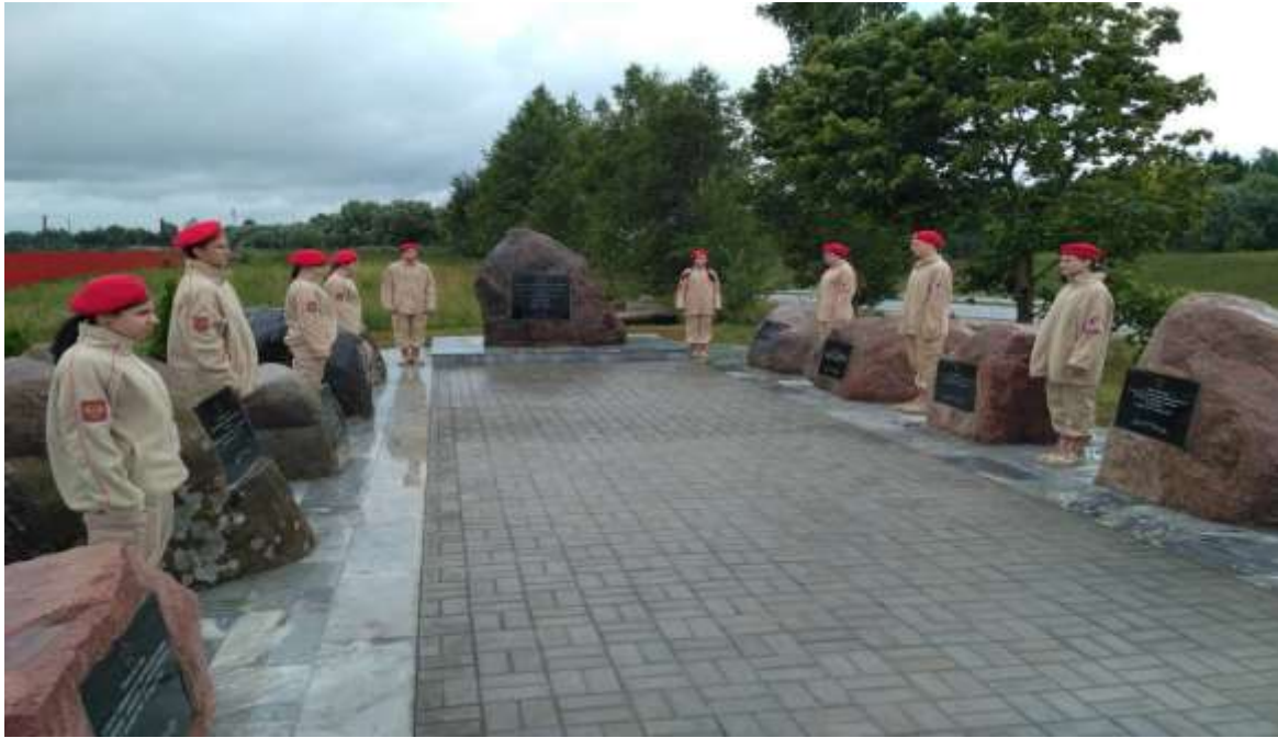
(юнармейцы в почетном карауле на Аллее партизанской славы)