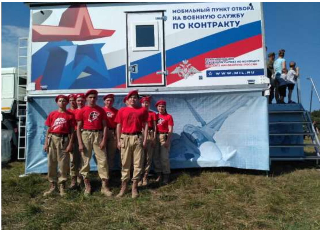
(юнармейцы на мероприятиях Министерства обороны)