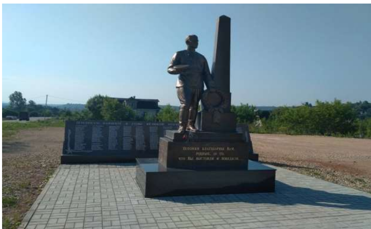
(памятник Воину освободителю)

С открытием памятника тесно связано еще одно важное событие – торжественное закрытие «Вахты памяти», в рамках которой были восстановлены имена четырех погибших бойцов красноармейцев, участников Великой Отечественной войны, имена которых восстановлены благодаря поисковикам. Во время проведения мероприятия их останки были освящены и отправлены родственникам в разные уголки России, где они будут с почестями преданы земле.