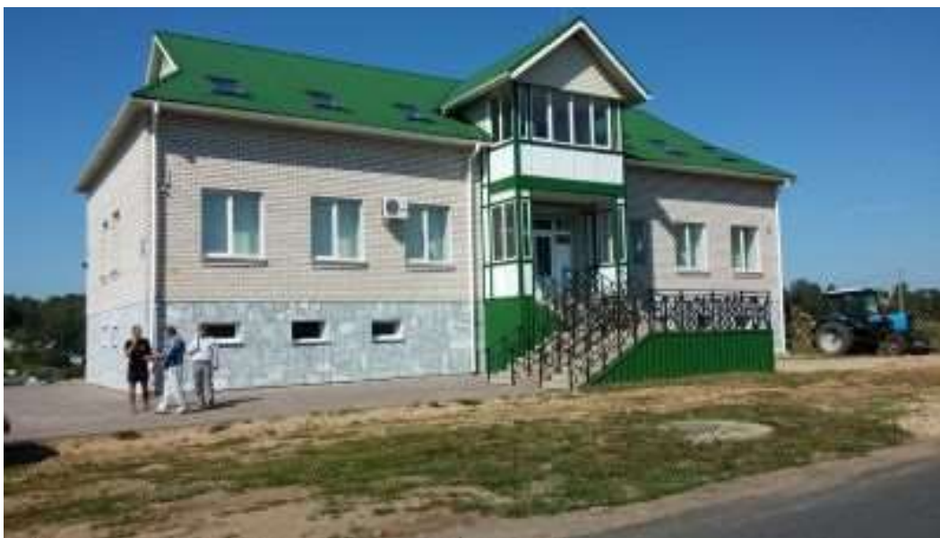
(здание Администрации Корохоткинского сельского поселения Смоленского района Смоленской области)

История музея началась в 2013 году. Местом расположения музея были определены помещения, расположенные на первом этаже здания Администрации сельского поселения.