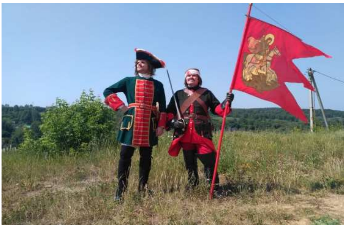
(костюмы с лева на право: 1) Государь Петр I; драгун русского полка 1708 год)