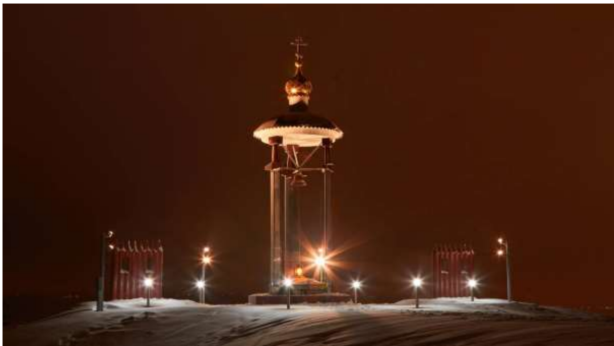
(монумент памяти русским воинам, героически защищавшим Смоленскую землю во время русско-польской войны)