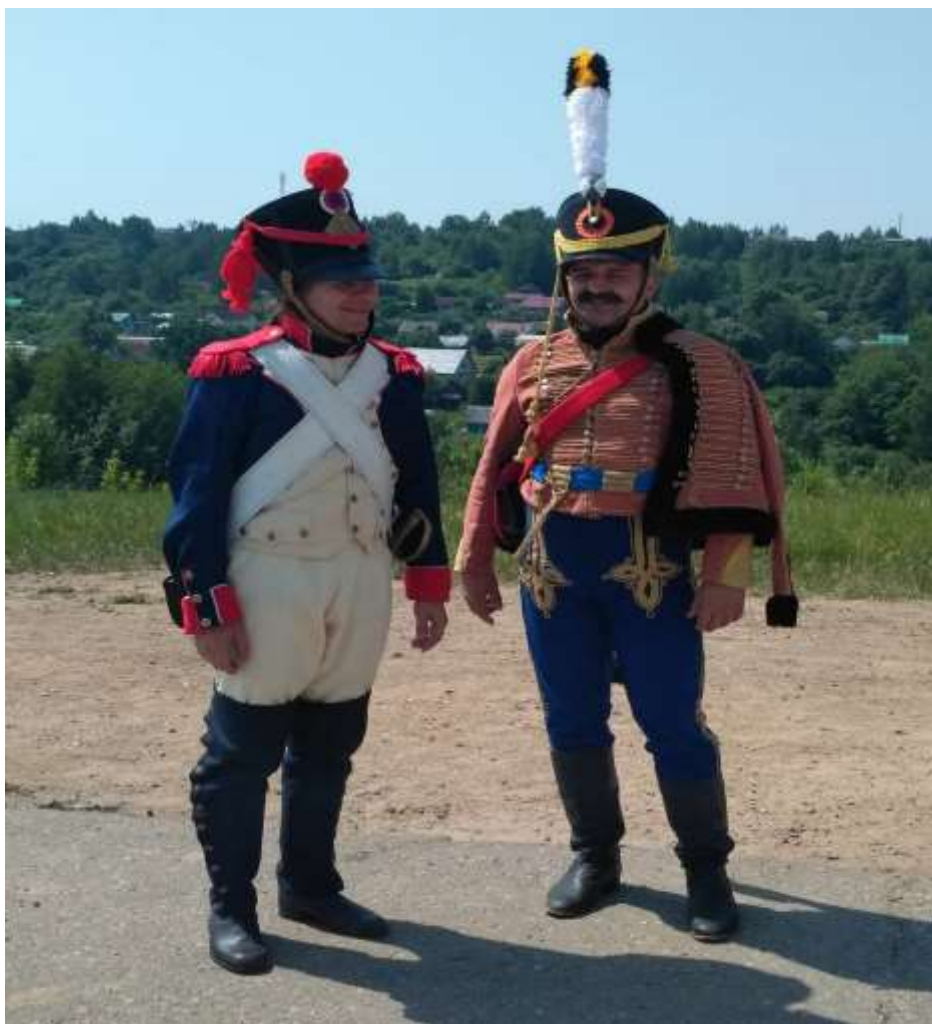
(костюмы с лева на право: 1) французский гренадер 1812 год; унтер-офицер Ахтырского гусарского полка, 1812 год)