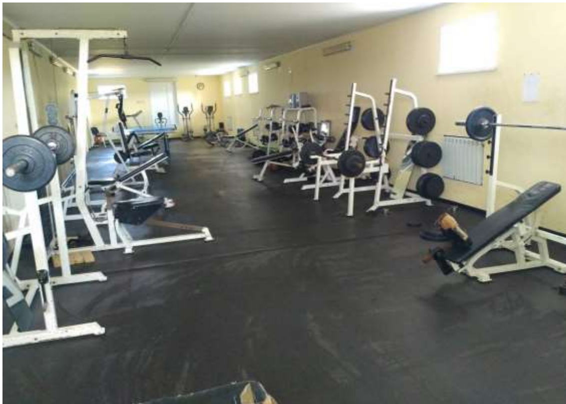
(тренажерный зал в помещении здания Администрации Корохоткинского сельского поселения)

В цокольном этаже здания Администрации Корохоткинского сельского поселения оборудован спортивный зал, где на регулярной основе занимаются не только местные жители, но и жители г. Смоленска.