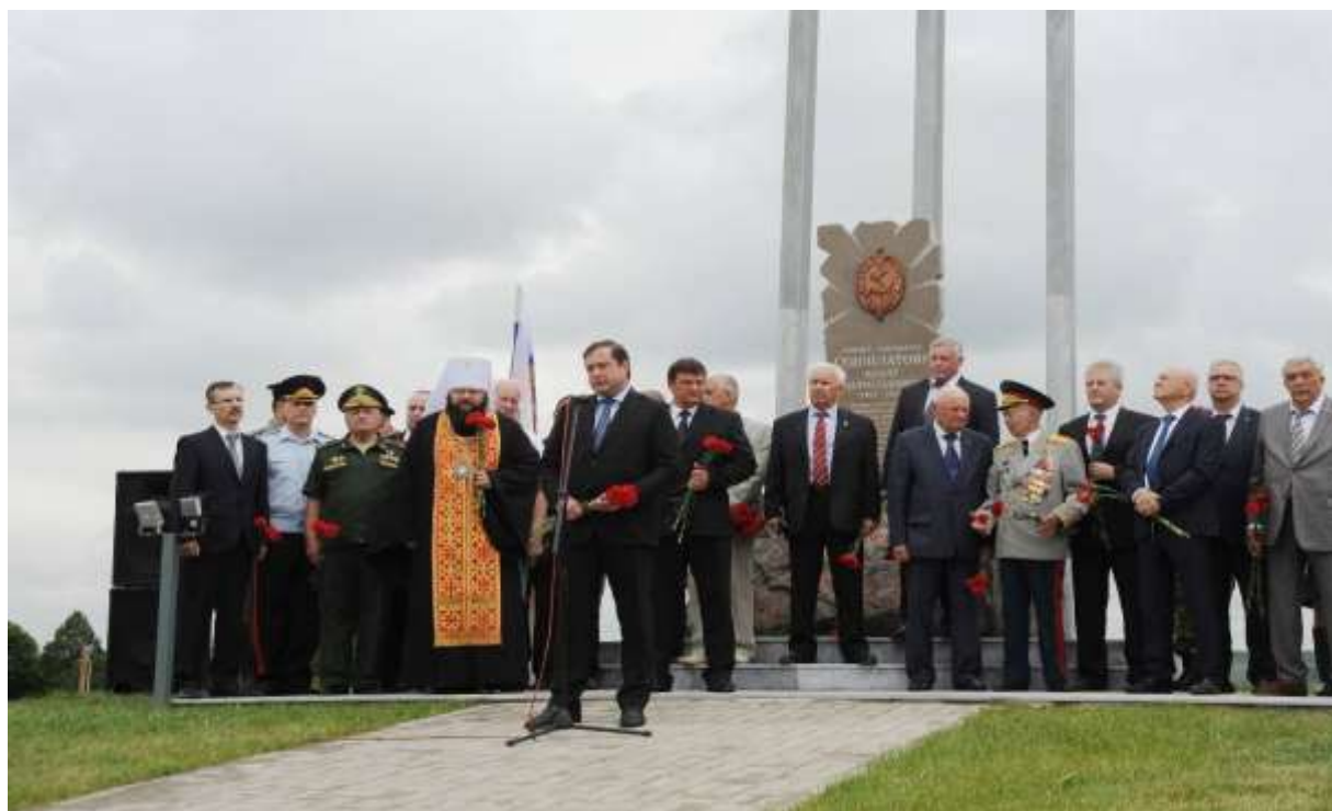
(приветственное слово Губернатора Смоленской области Алексея Островского)

Смоленская область была одним из крупнейших районов партизанского движения в годы Великой Отечественной войны.