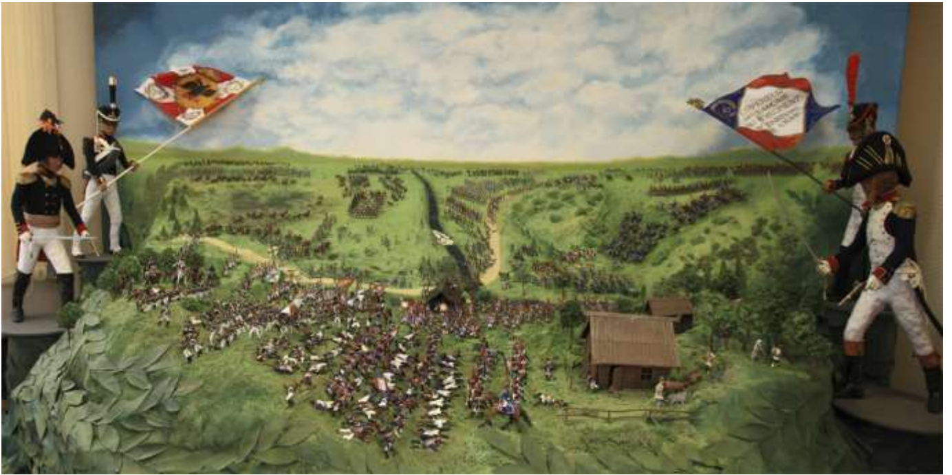
(диорама заключительного этапа сражения при Валутиной горе)