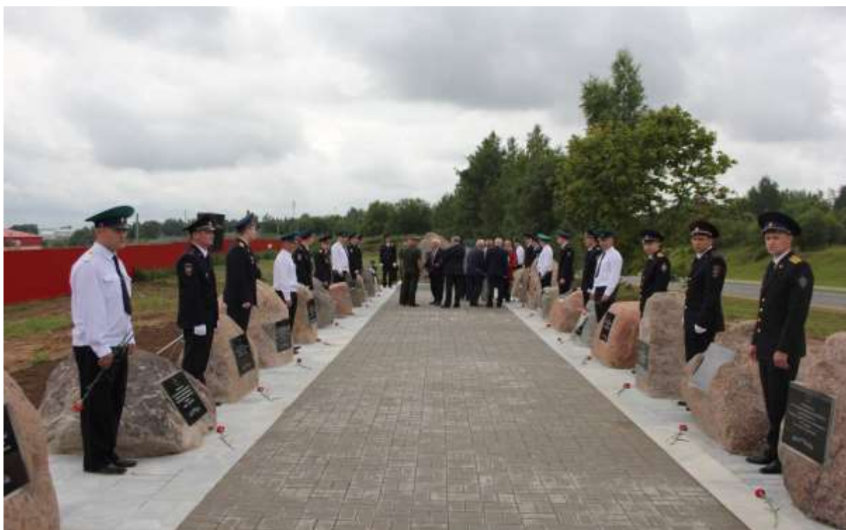
(почетный караул на Аллее партизанской славы)

Сама Аллея гармонично примыкает к памятнику знаменитому руководителю разведки и организатору партизанского движения в стране, автору известной книги «Разведка и Кремль» Павлу Анатольевичу Судоплатову. Открытие аллеи было приурочено ко дню партизан и подпольщиков.