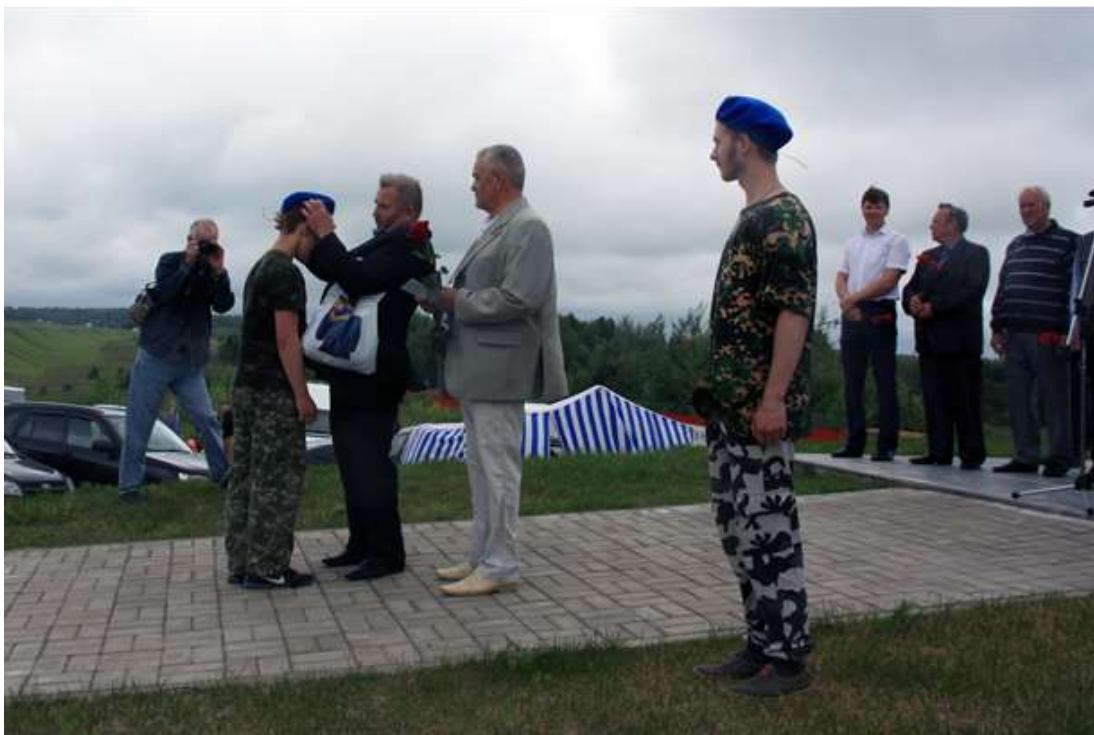
(вручение васильковых беретов участникам военно-полевых сборов у памятника П.А. Судоплатову)

внешней разведки, Ассоциации группы Вымпел, фонда КУОС-Вымпел имени Г.И. Бояринова, представителей различных структур.