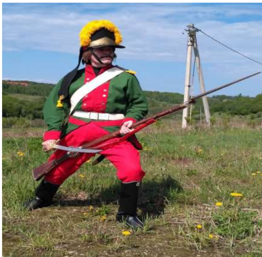
(костюм гренадер пехотного полка армии Г.А. Потемкина)