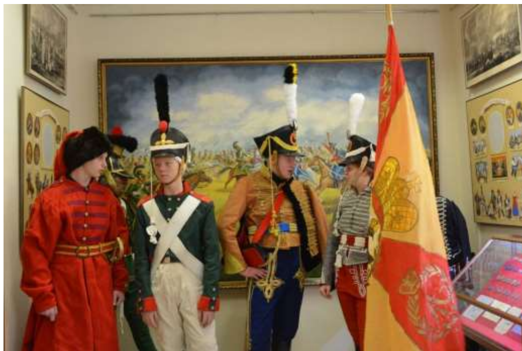
(костюмы с лева на право: 1) стрелец московского войска, 17 век; 2) гренадер Смоленского пехотного полка, 1812 год; 3) унтер-офицер Ахтырского гусарского полка, 1812 год, корнет Сумского гусарского полка)