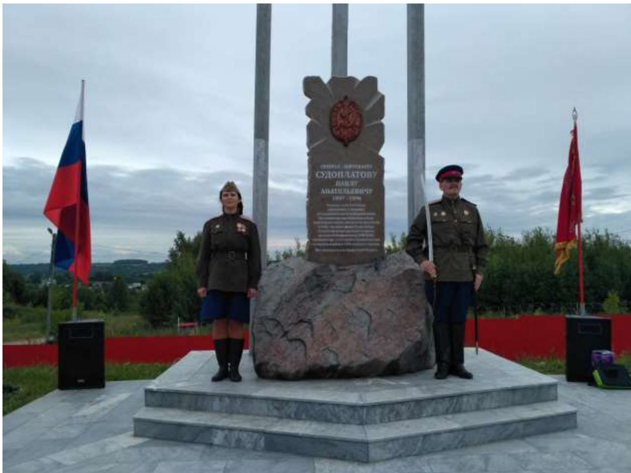
(памятник советскому разведчику, генерал-лейтенанту МВД СССР Павлу Анатольевичу Судоплатову)