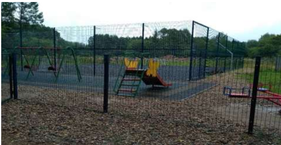
(баскетбольная площадка с резиновым покрытием в д. Синьково Смоленского района Смоленской области)

покрытия на покрытие из резиновой крошки на спортивной площадке в деревне Магалинщина.