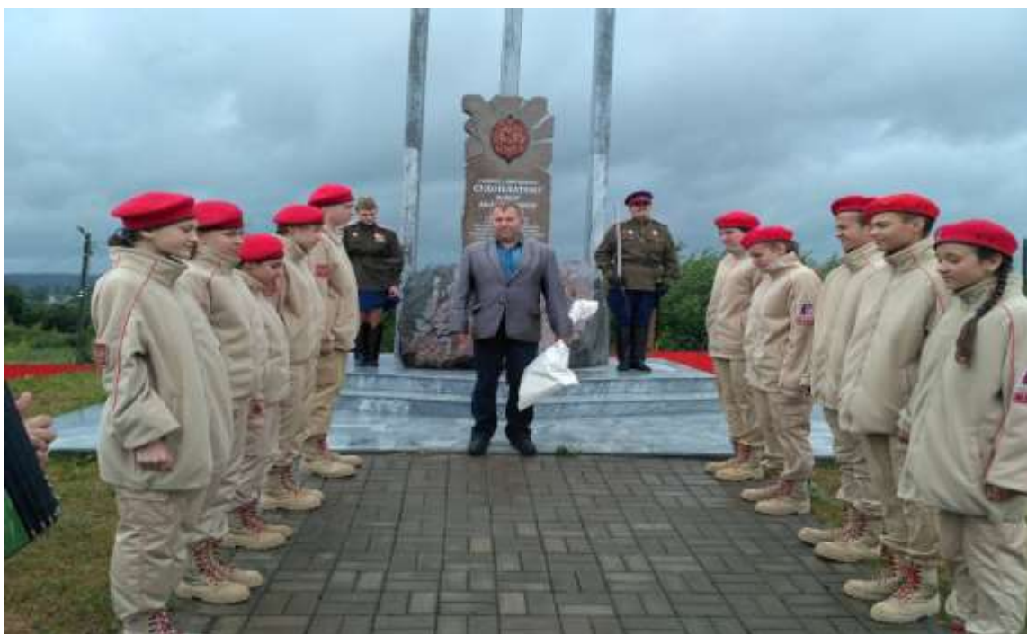
(юнармейцы в почетном карауле у памятника советскому разведчику, генерал-лейтенанту МВД СССР Павлу Анатольевичу Судоплатову)

На базе Синьковской средней школы создан юнармейский отряд, который активно принимает участие во всех проводимых мероприятиях не только на территории Корохоткинского сельского поселения, но и на территории Смоленской области.